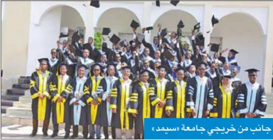
جانب من خريجي جامعة «سيمد»

احتفلت جمعية العون المباشر بمرور 20 عاماً على إنشاء جامعة سيمد في الصومال، والتي تخرج فيها حتى الآن أكثر من 6500 طالب، كما احتفلت بتخريج الجامعة دفعتها الخامسة عشرة لعام 2019 من طلابها البالغ عددهم 421 طالباً وطالبة، في تخصصات العلوم الإدارية والحاسوب والعلوم الاجتماعية والاقتصاد والقانون والتربية والهندسة.