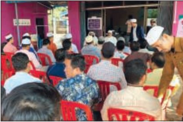
المشاركون خلال المحاضرات