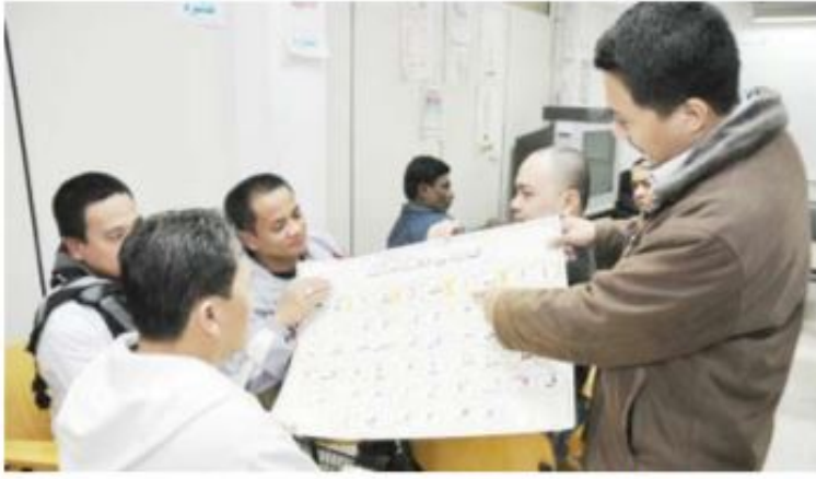
جانب من فصول تعليم اللغة العربية