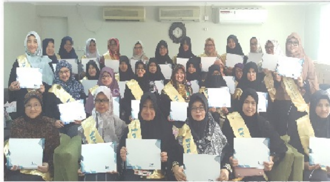
خريجات من الخلية الدراسية