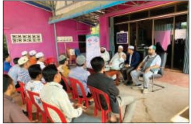
مسؤولو النجاة خلال إلقاء المحاضرات

فهكذا هم الأبناء يحتاجون منا التوجيه والنصح والمراقبة والمتابعة حتى يكونوا طاقات فاعلة ومشاعل نور تخدم الإسلام والمسلمين.