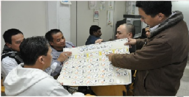
جانب من فصول تعليم اللغة العربية