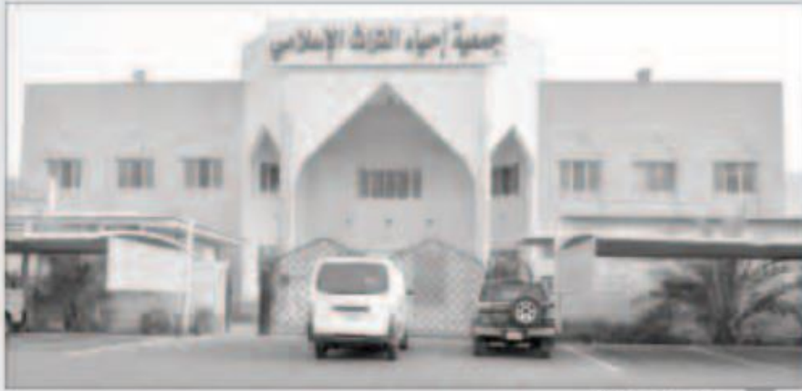
جمعية إحياء التراث

وجبات خفيفة ومشروبات ضيافة على الحضور، حيث لاقى هذا النشاط استحساناً وتفاعلاً من قبل الحضور، والجدير بالذكر أن اللجان النسائية التابعة لإحياء التراث تقوم بتنظيم العديد من الأنشطة مثل: الملتقيات والمحاضرات والدروس الشرعية التي تهدف لنشر العلم الشرعي الصحيح المستمد من الكتاب والسنة بين جمهور النساء.