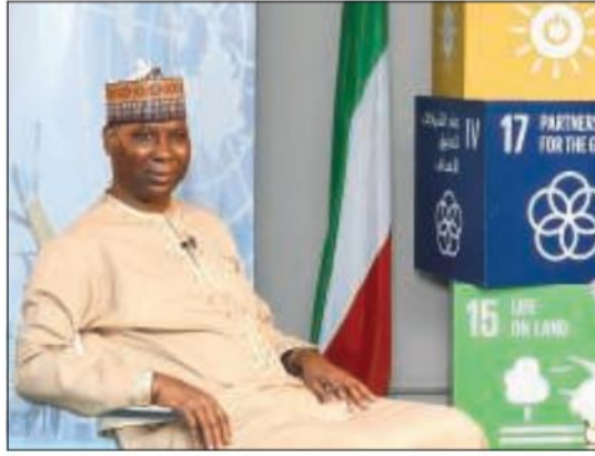
رئيس الجمعية العامة للأمم المتحدة تيجاني محمد باندري

رئيسا للجمعية العامة للأمم المتحدة في يونيو الماضي الى أن الكويت أخذت «زمام المبادرة» لأعوام عديدة على صعيد القضايا الإنسانية في جميع أنحاء العالم، وخاصة عبر مبادرات الصندوق الكويتي للتنمية الاقتصادية العربية. وأضاف أن جهود الكويت بصفتها عضوا حاليا في مجلس الأمن «مهمة لنا جميعا» خاصة من خلال «أنخراطها» مع الدول الأعضاء الأخرى في القضايا الحيوية. وشهدت زيارة محمد باندري للكويت إلقاء محاضرة في معهد سعود الناصر الصباح الديبلوماسية الكويتي حول