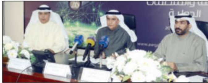
جانب من المؤتمر الصحفي