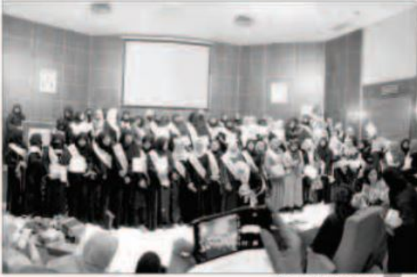
صورة جماعية للخريجات