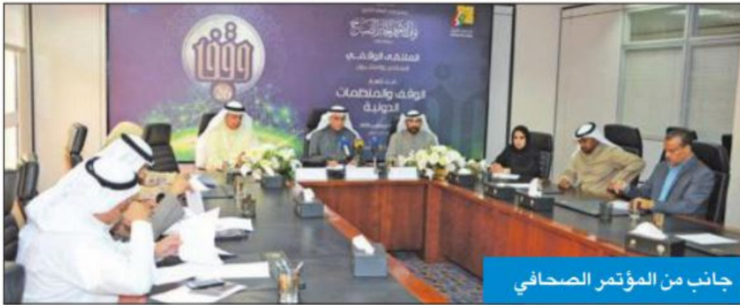
جانب من المؤتمر الصحافي