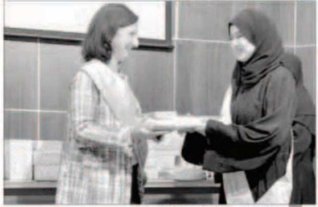
حرم سفير النمسا تشارك في توزيع الشهادات

إنها فتحت المجال لكل الجاليات المسلمة غير الناطقة بالعربية للتعزود بالعلم الشرعي. هذا وقد تضمنت الحفل تكريم الفائزات بمسابقة حفظ سورة الرحمن بالإضافة إلى تكريم الدارسات الفواتي. ختمت سورة البقرة تلاوة. كما تخلل الحفل عرضاً مرئياً لأنشطة قسم الفصول الدراسية بالإضافة إلى انشودة في حب رسول الله صلى الله عليه وسلم من تقديم مجموعة من المهديات الجدد. وفي نهاية الحفل تم تكريم الخريجات وتسليم الشهادات لهن.