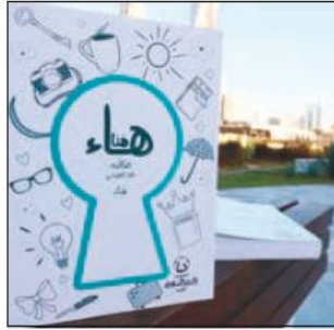
غلاف «هنا هاء»