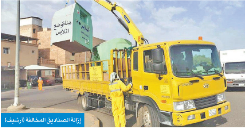
إزالة الصناديق المخالفة (أرشيف)

وأكدت أنه جار التنسيق مع بلدية الكويت لإزالة هذه الأكشاك، خصوصاً مجهزة المصدر، مضيفة أن «وجود مثل هذه الأكشاك، المجهولة، يشكل خطراً على العمل الخيري، ويفتح الباب على مصراعيه أمام الدخلاء وضعاف النفوس، الذين يجمعون التبرعات العينية والنقدية بطرق مخالفة، بعيدة تماماً عن أعين الوزارة وخارج نطاق سيطرتها».