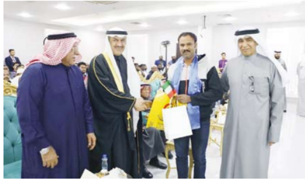
محافظ الجبراء يكرم أحد المشاركين