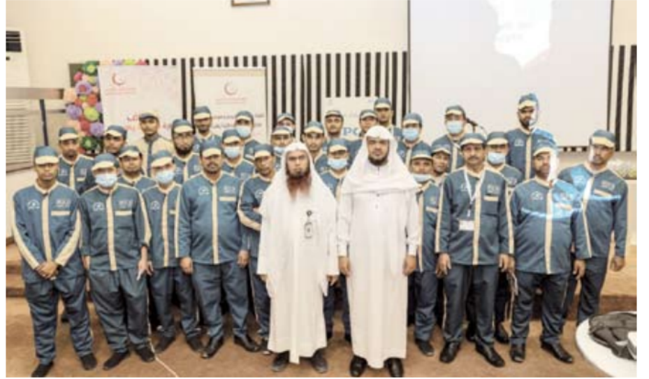
دور توعوي رائد للتعريف بالإسلام تجاه الجاليات

أكدت لجنة التعريف بالإسلام حرصها على تعريف ضيوف الكويت من الجاليات العاملة في القطاع الصحي بالإرشادات الصحية، وذلك في إطار