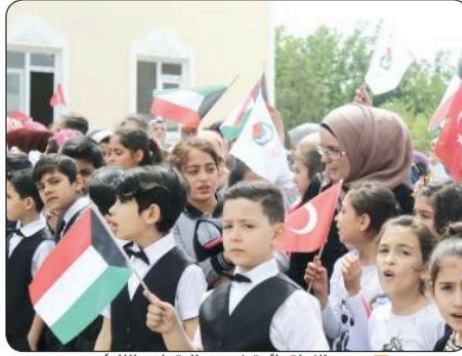
■ جهود النجاة رائدة في مجال تعليم اللاجئين