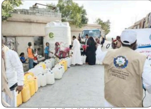
مساعداً إنسانية لتوفير المياه في اليمن