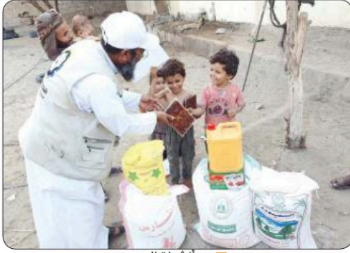
من أنشطة اليمن

الزامل : الكويت واحدة من أهم الدول المصدرة للعمل الإنساني الجمعية نفذت برامج ومشاريع وحملات خيرية بالتعاون مع الجهات الحكومية وغير الحكومية نسير وفق توجيهات وزارة الشؤون في تنفيذ الأعمال الإنسانية