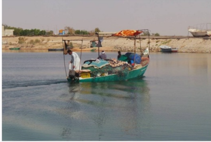
قارب صيد في نهر النيل أسوان

أعلن المكتب الكويتي للمشروعات الخيرية بالقاهرة، أمس، تسليم 24 قارب صيد قيمتها 9800 دينار، دعماً من جمعية النجاة الكويتية للأسر الأولى بالرعاية في أسوان، أقصى جنوبي مصر، ضمن مبادرة لتمكين تلك الفئة اقتصادياً.