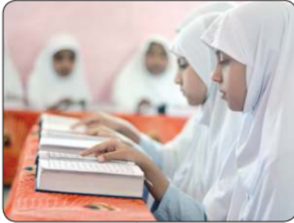
■ من طلبة «النجاة» الأيتام خارج الكويت

أعلن رئيس القطاع الثقافي ومدير إدارة التعليم الخارجي بجمعية النجاة الخيرية إبراهيم البدر عن تنفيذ الجمعية لمجموعة من المشاريع التعليمية حول العالم تشمل بناء المدارس والمراكز التعليمية ، والكفالة التعليمية للطلبة ، وتوفير الزي والحقيبة المدرسية ، وسكن ودورات تأهيل للمعلمين ، بالإضافة إلى بناء وبناء المعاهد والمراكز الإسلامية وكفالة