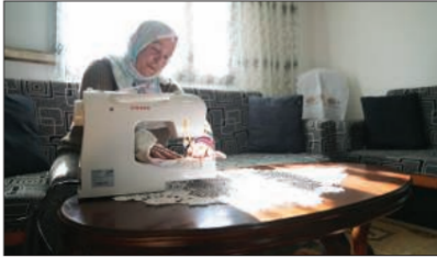
من مشروع توزيع مكائن خياطة