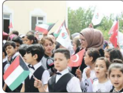
■ جهود «النجاة» رائدة في مجال تعليم اللاجئين

النجاة الخيرية: 70 ألف مستفيد من مشاريعنا التعليمية داخل وخارج الكويت