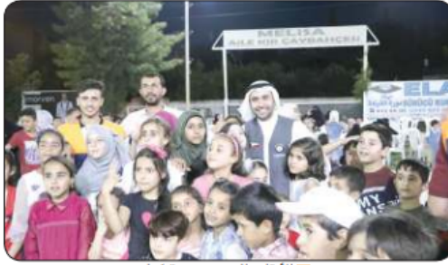
■ الأيتام السوريون بتركيا