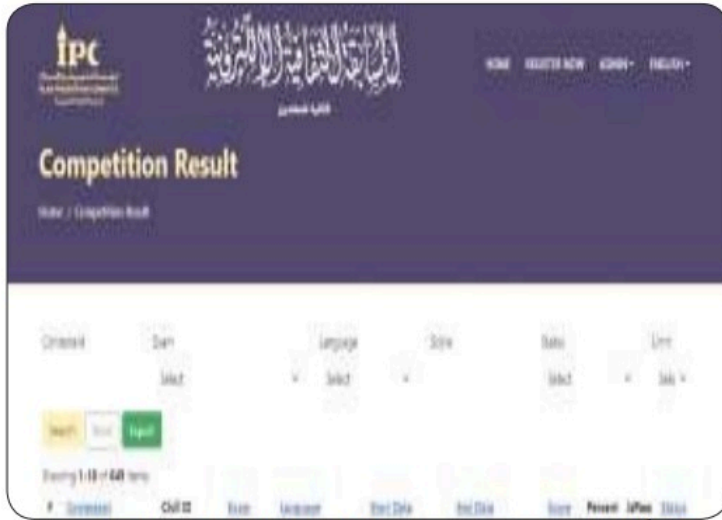
■ أنشطة «التعريف» مستمرة لشحذ الازع الديني للمهتدين