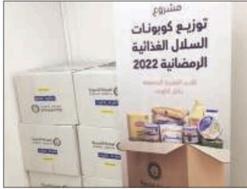
نماذج لكراطين السلال الرمضانية