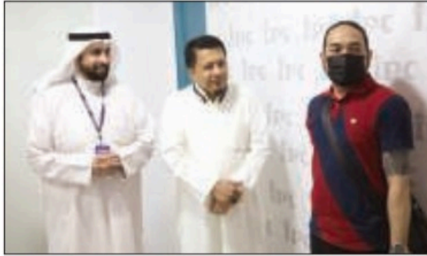
البدر وأحد دعاة اللجنة خلال إشهار أحد الوافدين إسلامه

إلى تعليم المهتمين الجدد، لصياغة مسلم جديد يعكس أخلاق الإسلام، ويكون إشعاع نور لهداية غيره للإسلام. وحثّ البدر الجميع على المشاركة في دعم الحملة، مبيناً أن باب المساهمة متاح للجميع كل قدر استطاعته، للمشاركة في دعم الحملة من خلال زيارة الموقع الإلكتروني للجنة، وحساباتها عبر «السوشيال ميديا»، أو الاتصال على الخط الساخن (97600074).