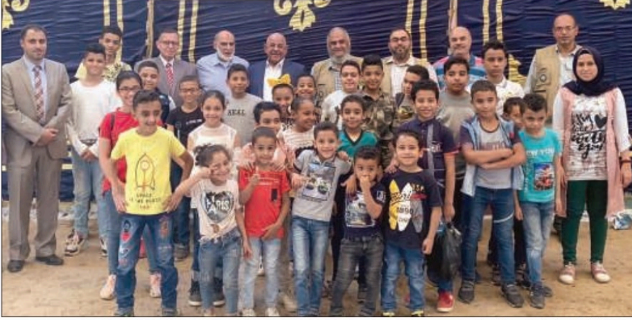
عدد من الأيتام الذين تكفلهم جمعية النجاة