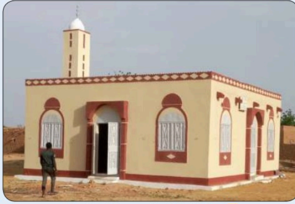
مساجد النجاة الخيرية بجمهورية النيجر الصديقة

وقال الخميس مشروع بناء المساجد تنفذه الجمعية في أكثر من 22 دولة حول العالم، وتتفاوت قيمة المسجد تبعاً للمساحة وعدد المصلين وطبيعة الدولة التي سينفذ بها المشروع. مستشهداً بحديث النبي صلى الله عليه وسلم: « ومن بنى مسجداً كمفحص قطاة أو أصغر بنى الله له بيتاً في الجنة » وختاماً دعا الخميس كل من يرغب في بناء مسجد إلى التواصل مع زكاة كيفان من خلال الاتصال على أو زيارة مقر اللجنة بجانب سوق كيفان المركزي 95516222.