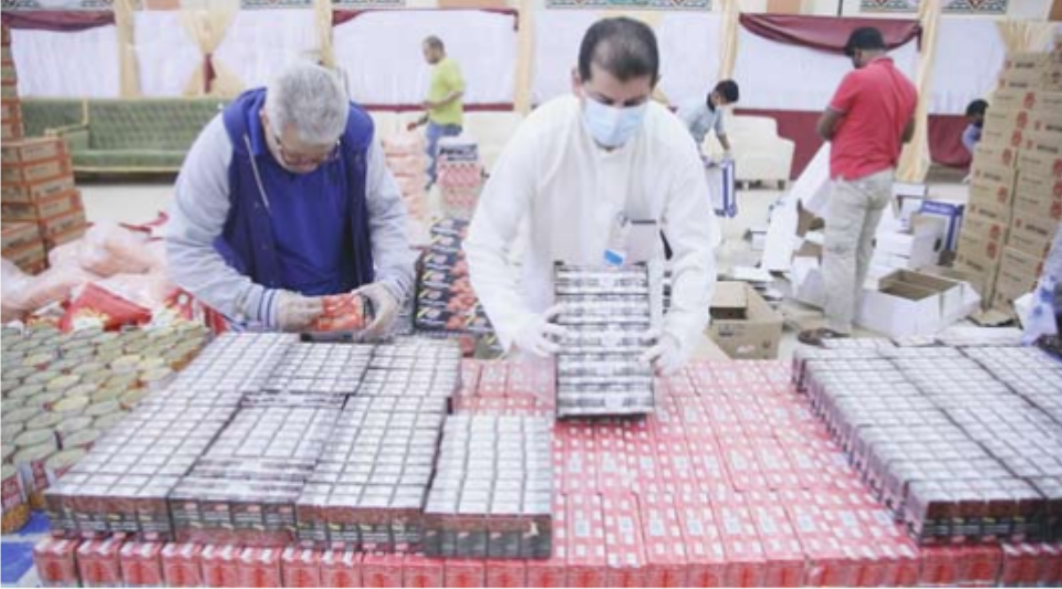
تجهيز السلال الغذائية