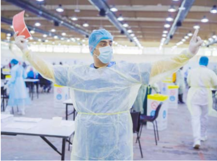
جهود مشرفة للطواقم الطبية